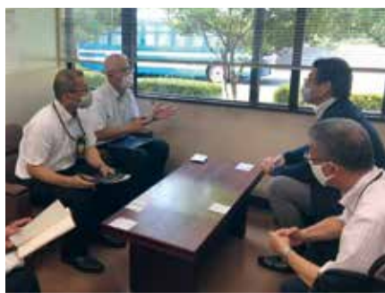
運転免許センター長と 対応策を協議する幸太郎県議

一方、利用者から「館内が混雑している」といったご意見が寄せられていることも踏まえ、今後も、他県状況なども参考にしながら、更なる県民の利便性向上に努めてまいります。と考えております。