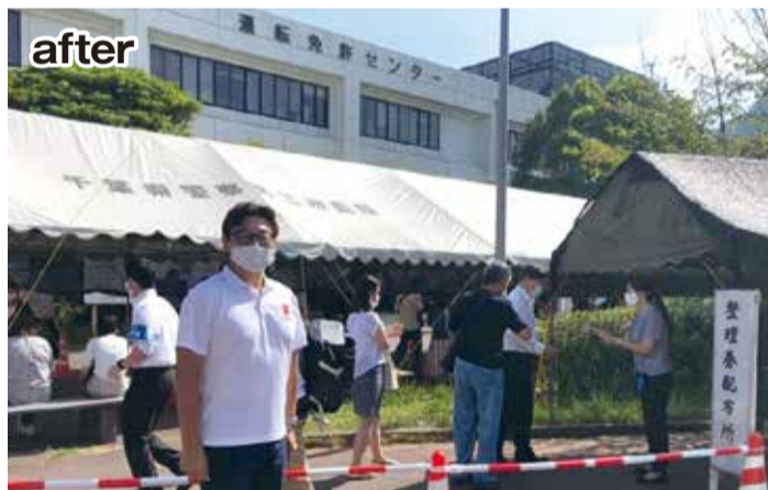
▲ 整理券の配布で屋外での列が解消