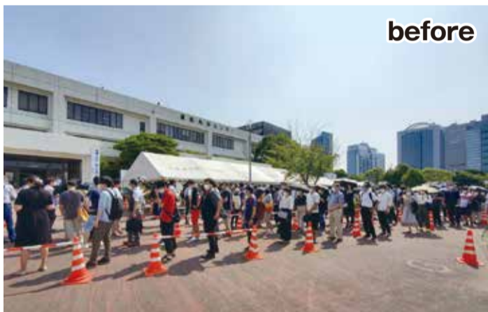
▲ 免許更新に訪れた県民が炎天下のなか長蛇の列

警察本部長 県内の運転免許保有者数は、令和元年末現在、約404万人であり、令和元年中は約83万人の方が運転免許の更新手続を行いました。更新者数の施設別内訳は、千葉県運転免許センターが約49万人、流山運転免許センターが約18万人、警察署等が約17万人となり、約8割の方が運転免許センターにおいて更新手続を行っております。このように、従来から運